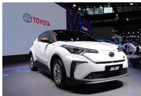
奕泽 IZOA EV

2019年，被丰田称作中国战略的“实现”之年，通过在现实世界推进“电动车”的普及，为改善环境做出贡献。在4月的上海车展上，基于TNGA丰巢概念首款SUV C-HR和奕泽IZOA开发的EV车型首次面向全球公开亮相。作为丰田首款量产电动车，它们的到来将为中国消费者提供更加多元化的选择。两款车型计划于2020年开始在中国市场销售。